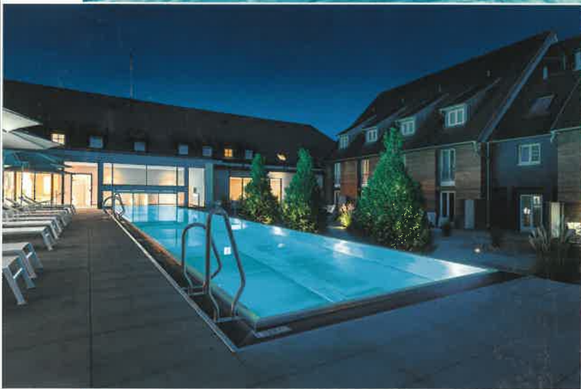
Das Schwimmbecken ist unter anderem mit LED-RGB-Scheinwerfern ausgestattet, die das Wasser des Pools bei Einbruch der Dunkelheit in ein Lichtermeer hüllen.