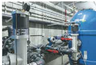
Unmittelbar am Becken im Untergeschoss ist die Ospa-Technik installiert.

Unmittelbar an der Beckenlängsseite im Untergeschoss wurde ein 3 m breiter Technikgang geschaffen, in dem die Ospa-Schwimmbadtechnik installiert ist. Dem Standard für Hotelbäder entsprechend ist die Ospa-Technik nach DIN ausgelegt und beinhaltet zwei 1000er Filteranlagen, die Desinfektionstechnik BlueClear, Dosiertechnik für pH-Heben und -Senken, den Schaltschrank sowie die Ospa-Steuerung BlueControl. Am Display können alle Wasserwerte kontrolliert und bei Bedarf korrigiert werden. Beheizt wird das Schwimmbecken über ein Blockheizkraftwerk, das im Zuge der Neubaumaßnahmen ebenfalls installiert wurde und dessen Strom und Wärme jetzt auch für das Hotel verwendet wird. Auch sonst ist der Pool mit neuester Energiespar-technik ausgestattet. Im Ruhebetrieb, wenn die Rollladen-Abdeckung ausgefahren ist, wird der Wasserspiegel abgesenkt, das heißt die Rinnen werden trockengelegt, und die Umwälzung erfolgt nur noch über die Bodenabläufe. Das bedeutet, betont Heiko Zeuner, dass kein Wasser mehr über die Rinnen verdunsten kann und damit der Wärmeverlust erheblich reduziert wird, aber trotzdem die Umwälzung vorschriftsmäßig 24 Stunden gewährleistet ist. Das spart erheblich an Energie und wurde auch durch das Gesundheitsamt so genehmigt.